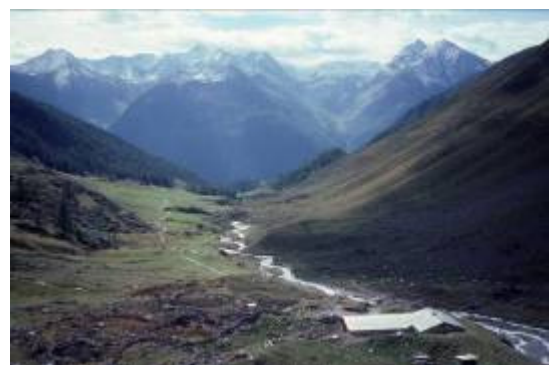
Blick das Val Tuoi hinaus zum Inntal