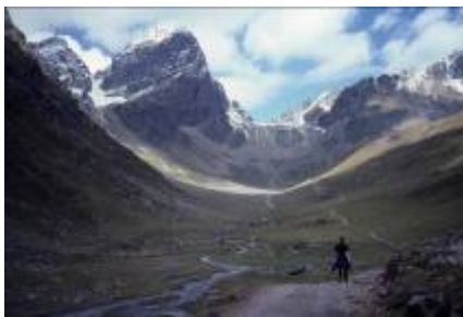
Talabschluss mit Piz Buin