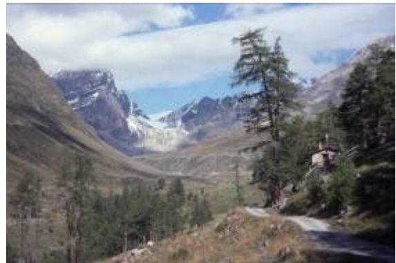
Blick ins Val Tuoi hinein