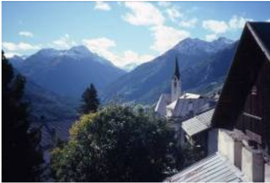
1 Herbsttag in Guarda (Bild links)

Vom Sonnenbalkon Guarda zum Sonnenbalkon Ftan - dazwischen gehts fast bis Ardez hinunter. Die Aussicht übers Tal ist toll. Wer das Ganze mit dem Velo macht, wird auch die Abfahrt von Ftan nach Scuol genießen - und dann entweder als Dessert nach Sent hinauf pedalen oder das Velo dem Postauto mitgeben.