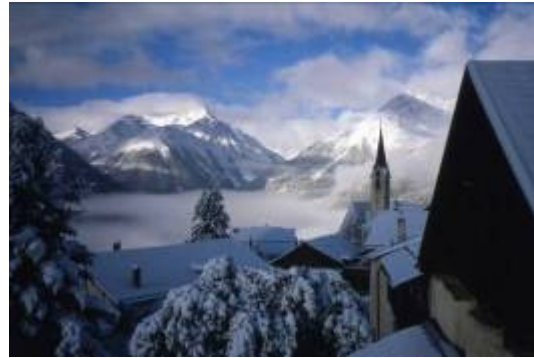
- Übernachtung mit Schneefall - 1 Wintertag (Bild rechts) mit besagter Wanderung