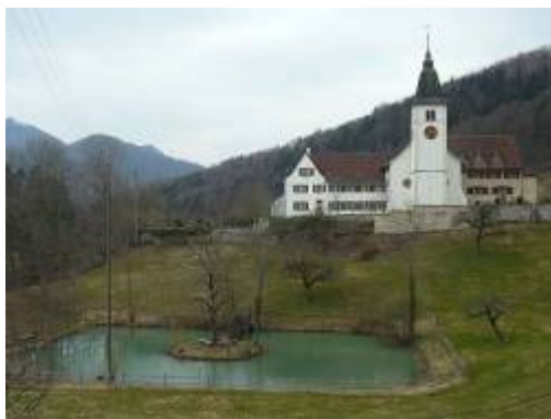
Kloster Beinwil ( www.klosterbeinwil.ch )