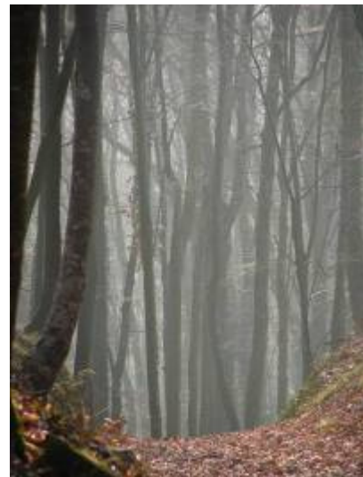
Vor lauter Bäumen...