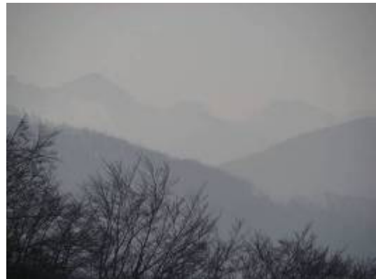
gegen das Mittelland: Herbstnebel