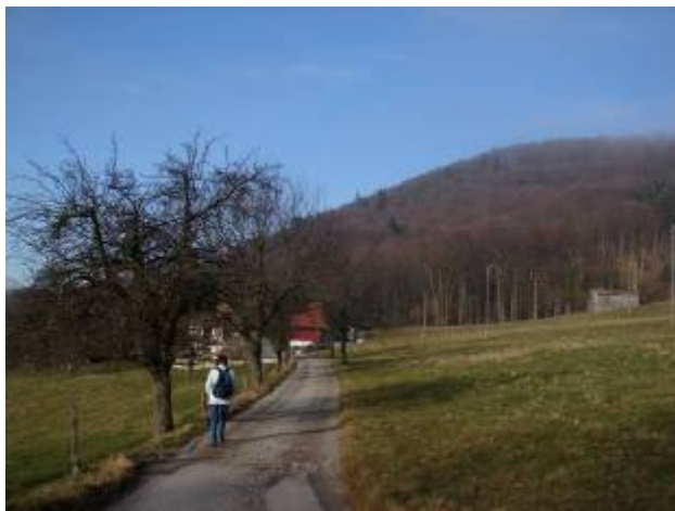
im Baselbiet: Sonne!