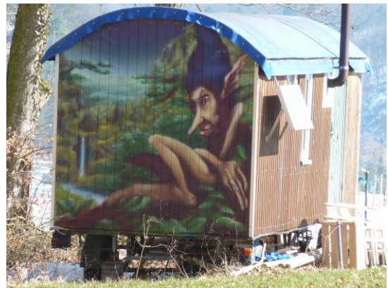
Siehe da: Auch der Waldgnom hat eine Hütte...