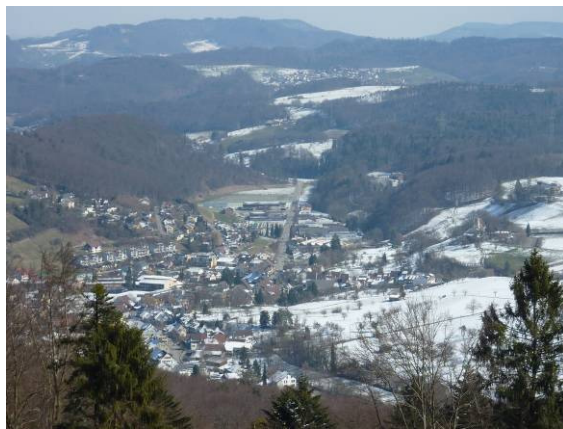
Blick ins Fünfliedertal